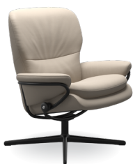
Niedriger Rücken/ Cross Untergestelle