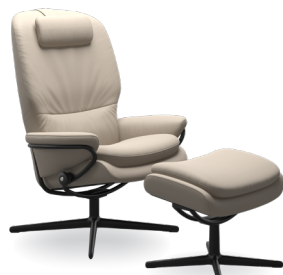
Verstellbare Kopfstütze Cross Untergestelle