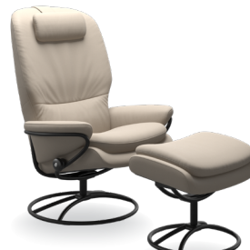
Hoher Rücken/ Original Untergestelle