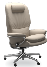
Hoher Rücken/ Home Office Untergestelle