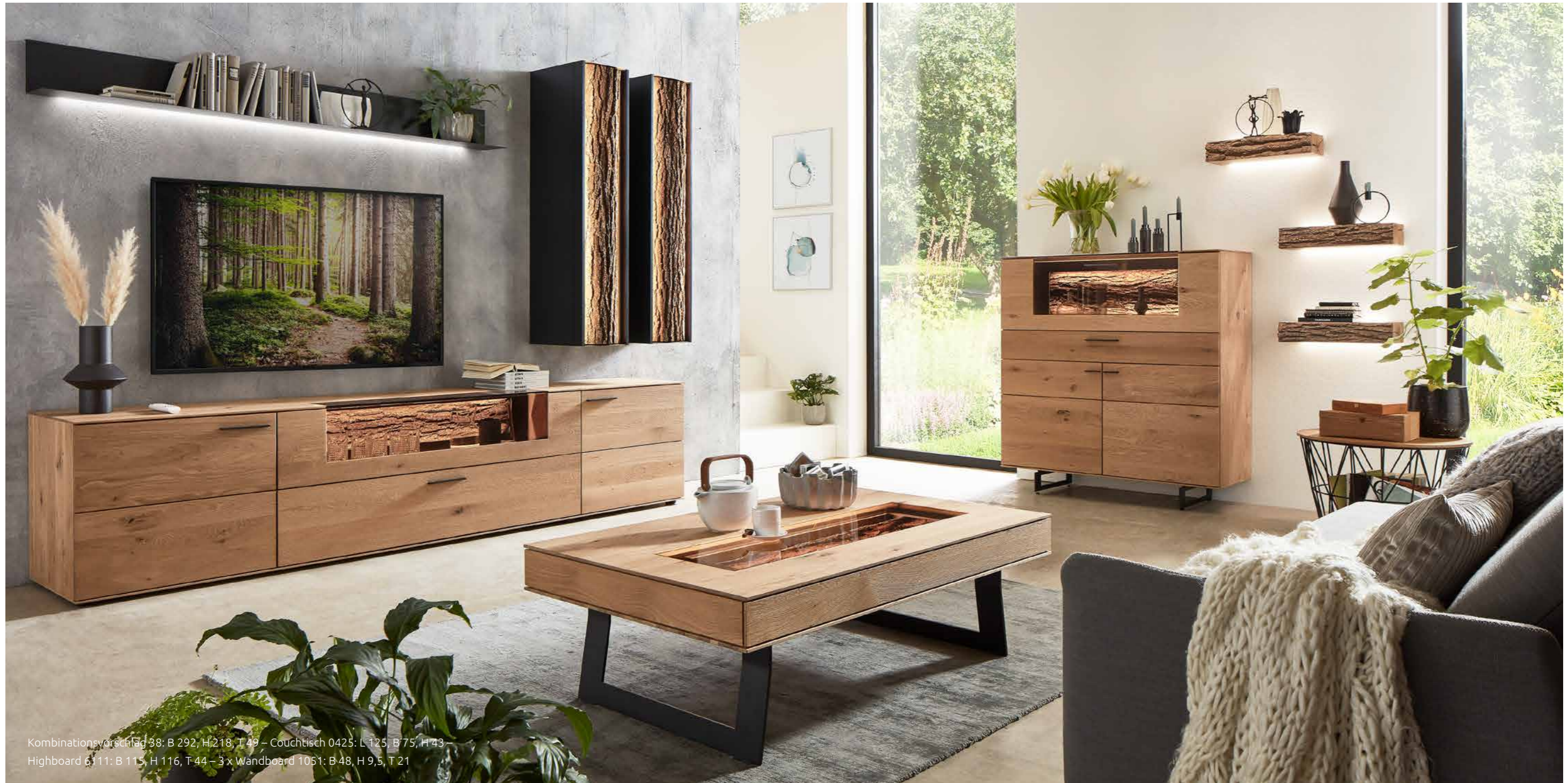
Kombinationsvorschlag 38: B 292, H 218, T 49 – Couchtisch 0425: L 125, B 75, H 43 – Highboard 6311: B 115, H 116, T 44 – 3 x Wandboard 1051: B 48, H 9,5, T 21