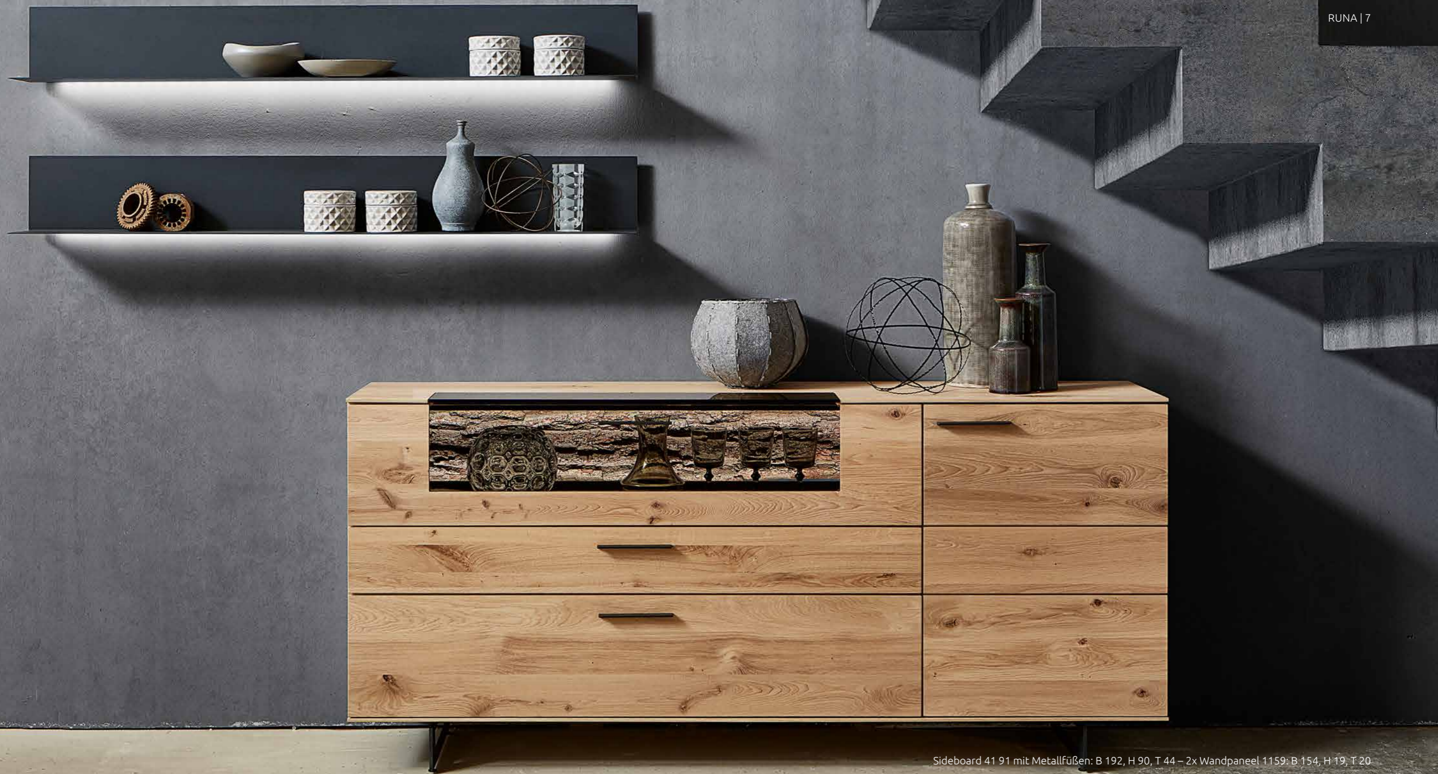
Sideboard 41 91 mit Metallfüßen: B 192, H 90, T 44 – 2x Wandpaneel 1159: B 154, H 19, T 20