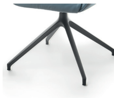
1016 Spinnenfuß drehbar schw. matt strukt. (gegen Aufpreis)