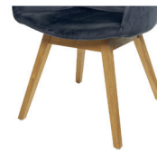
993 Holzgestell Eiche geölt (gegen Aufpreis)