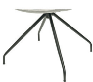
991 Spinnenfuß drehbar schwarz matt (gegen Aufpreis)