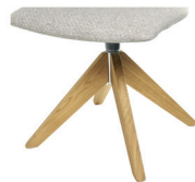
994 Spinnenholzfuß drehbar Eiche geölt (gegen Aufpreis)