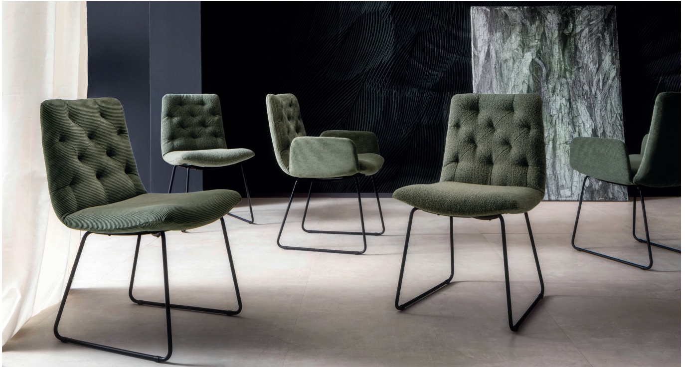
Stuhl und Armlehnenstuhl