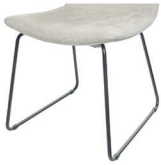
990 Metallgestell schwarz matt Standard